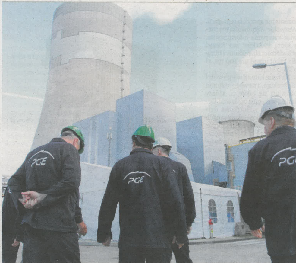
Wielu akcjonariuszy pracuje w bełchatowskiej elektrowni. Dywidendę otrzymało łącznie 5,6 tys. osób

W pierwszej instancji Socrates sprawę wygrał, podobnie w apelacji. Koncern dywidendę za 2009 musiał akcjonariuszom wypłacić. I to niemałą. Ponad 5,6 tys. osób otrzymało w sumie ok. 120 mln zł. Pracownicy elektrowni mający pakiet ok. 6-7 tys. akcji mogli liczyć na ponad 20 tys. zł. Koncern zastrzegł jednak, że być może wnieśnie kasację i pieni-